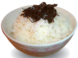
熱いごはん、とろりとかけると、箸がとまらない「めし泥棒」と呼ばれる。また、味噌汁に入れたり酒の肴としても磯の風味と独特の粘りが楽しめる。

くろめは傷みが早いのが難点で、段取りのよい作業が求められる。早朝に採取された「くろめ」は浜で巻かれ、当日に加工グループが漁協経由で入手している。これを細かく刻んで冷凍することで、鮮度を保つたまま長期保存が可能となり、自然解凍することで「佐賀関くろめ醤油味付」は通年製造することができ。昔ながらの製法と食文化を伝承するため、原料は佐賀関産の「くろめ」だけを使用し、防腐剤などの添加物は加えていない。