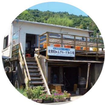
佐賀関漁協からは約3キロ、臼杵湾に面した加工場で製造している。