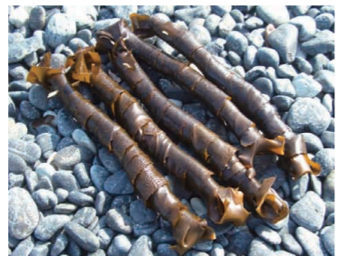
採取されてすぐ、浜で巻かれたもの。「くろめ巻き」と呼ばれる。

漁期は1月中旬から3月中旬までの2カ月のみ。これは「くろめ」がアワビやサザエの餌になることから、海洋資源保護と海の生態を守るために規定されている。漁期には、やわらかな新芽がのびるため、えぐみが少なく、粘りも強く最もおいしくなる。ただし、