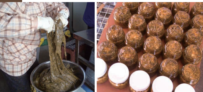
写真左 / 刻んだ「くろめ」と調味料を混ぜていくと、だんだん粘りが出てくる。 写真右 / 瓶詰の後で、独自の殺菌処理がなされ、ラベルを貼ってできあがる。

原料となる「くろめ」の採取を行うのは、昔からこの海域の漁業権を持つ漁師たちである。早朝に小舟で採取した「くろめ」を、鮮度が落ちないうちに棒状に細く長く巻きつける作業光景は、佐賀関の冬の風物詩となっている。